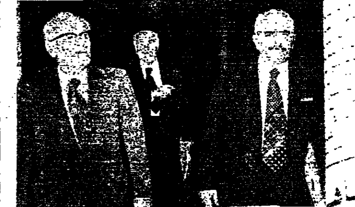
الوزراء فرجية وكما في قصر امس ، ويبدو الرئيس صايل ان

تجدد الجهود الذي شهدته العاصمة والضواحي ، خلال الاسابيع العشرة الاخيرة ، عندما اصبحت الاحياء في منطقة كفرشيما ، وامتدت الى النبعة ومن الليل ، وضواحي الجبل والكرنينا . وارتفعت بومرة الخطف بصورة مقلقة ، حتى وصل عدد المخطوفين الى اكثر من مئتين ، اخرج عن معظمهم خلال الليل . وحصلت الاستبيكات كالتالي ٣ قتلى و ١٤ جرحا ، وتتم الطور على ٤ جرح مبرزة . وقد حلت هذه التطورات رئيس الحكومة على دعوة لجنة التنسيق العليا الى اجتماع طارئ عقب مساء في مقر الان العام ، تركز على عملية اعادة المخطوفين وحصر الاصحابات الجديدة التي نظمت فيها المنفعية والصواريخ . وهاجر الخطف الطائرة ظهرت منذ الصباح ، من مستديرة قصر العدل حتى كورنيش الزعرة ، قرب مستشفى البرير ، امتدادا الى شارع فردان ، وشبارة الخوري ، ومحلة الصفي . وبلغ مجموع عدد المخطوفين بعد الظهر حوالي ٢٢٥ شخصا بينهم ١٢٥ شخصا في محلة النبعة ، و١٤ جرحا ، و١٥ مخطوفا نسي طبرجا ، و ٥ مخطوفا بالقبائل من الجانب الاخر في محلة النبعة وجوارها ، وحوالي ٢٥ شخصا في بيروت والضواحي . البقية على ص ٨ عود ٥ - ٥